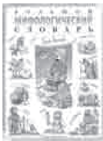
■ Розе Т. В. Мифологический словарь для детей / Т. В. Розе. — М. : ОЛМА Медиа Групп, 2011. — 224 с. : ил.