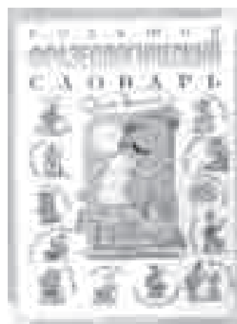
■ Розе Т. В. Большой фразеологический словарь для детей / Т. В. Розе. — М. : ОЛМА Медиа Групп, 2011. — 224 с. : ил.