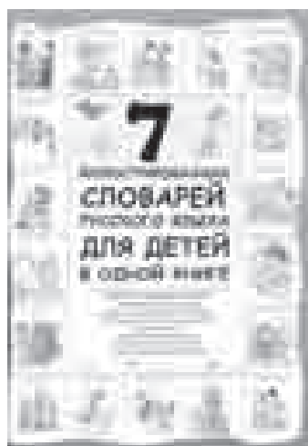
■ 7 иллюстрированных словарей русского языка для детей в одной книге / авт.-сост. Д. В. Недогонов. — М. : АСТ : Астрель, 2010. — 206 с. : [2] ил.